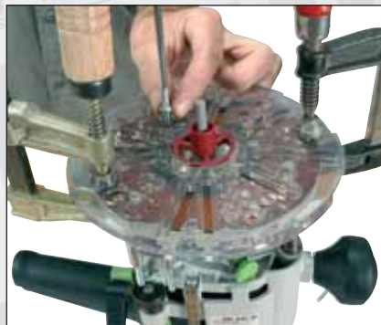
Vue n° 4: Fixation de l'embase universelle.

En faisant tourner l'embase universelle autour du cône de centrage, faites en sorte qu'au moins deux des perçages dont elle est munie soient alignés avec deux trous taraudés de la semelle de votre défonceuse. Immobilisez alors l'embase universelle dans cette position à l'aide de deux presses afin de conserver précisément le centrage obtenu. Il ne vous reste plus qu'à fixer fermement l'embase universelle à l'aide de deux (au minimum) ou trois vis (vue n° 4). Si les trous prévus d'origine sur l'embase universelle sont trop larges et laissent passer au travers la tête des vis, alors n'hésitez pas à munir celles-ci de rondelles. Pour être certain de conserver un parfait centrage de l'embase universelle jusqu'à sa fixation définitive, ne retirez les deux presses qu'à la fin de l'opération. Vous pouvez alors ensuite débloquer le mouvement plongeant de la défonceuse puis retirer le cône de centrage de l'arbre: pour pouvoir le dégager il sera peut-être nécessaire d'ôter la bague de copiage.