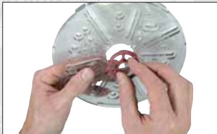
Vue n° 2: Montage d'une bague de copiage sur l'embase universelle.

Fixez une bague de copiage sur l'embase universelle transparente. Cela s'opère par un léger mouvement rotatif de la bague à insérer. Choisissez la bague de copiage du diamètre le plus important dont vous disposez (vue n° 2).